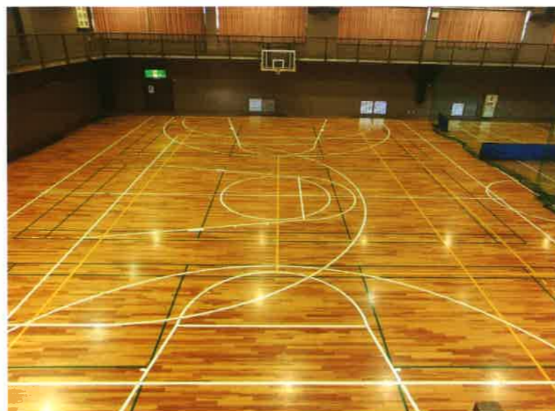
第1体育室（競技フロアー）