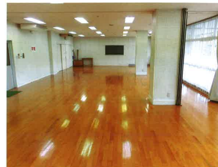
第3体育室（体育室兼会議室）